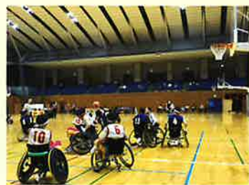
通常のバスケット同様試合は白熱の展開

車椅子バスケットボールチームポッキーズは、選手6名とコーチやマネージャー3名で活動を行っています。主な活動の拠点はJR粟津駅近くの小松サン・アビリティーズで、週1回練習を行っています。その他にも金沢のおつみ体育館で月1回程度不定期に練習を行っています。選手はコーチやマネージャーから必要な部分の手助けを借りて練習に参加しています。練習は選手だけではなくコーチやマネージャーも車椅子に乗って参加しています。少しでも興味のある方は、ぜひお気軽に練習の場に顔を出してみてください。