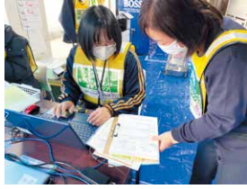
ボランティアの安全確保のため、活動内容を確認します(羽咋市)