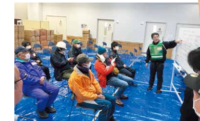
オリエンテーションで災害 VC のルールを伝えます(中能登町)