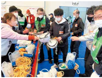
ボランティアへ資機材の貸し出しをします(中能登町)