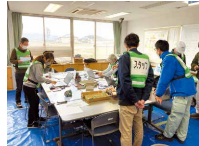
R4水害のときの恩返しを社協ネットワークで取り組みます(小松市)