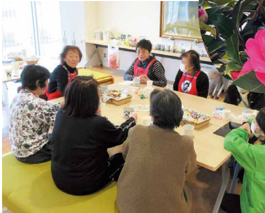
九谷焼カップでお茶飲んで、じんのびしていくこっちゃんね〜(能美市)