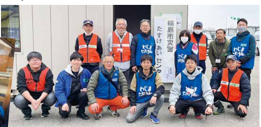
地元住民も社協と共に災害たすけあいセンターのメンバーとして活躍しています(輪島市)