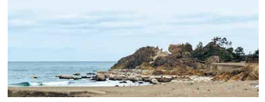
曾々木海岸は輪島市と珠洲市をつなぎます(輪島市)