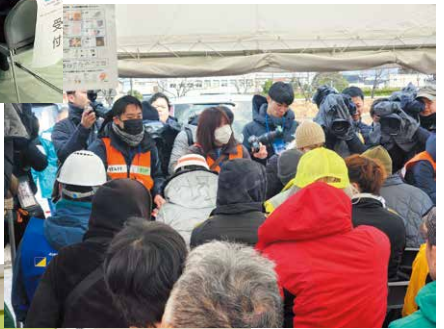
応援社協職員がボランティアバスで来た活動者へ説明を行います(輪島市)