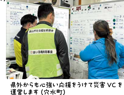
県外からも心強い応援をうけて災害 VC を運営します(穴水町)