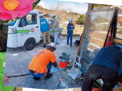
災害廃棄物を丁寧に仕分けします(珠洲市)