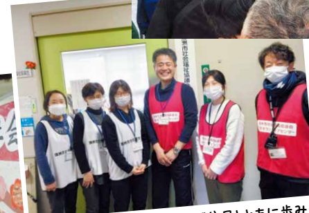
災害 VC & ささえ愛センターで住民とともに歩みます(珠洲市)