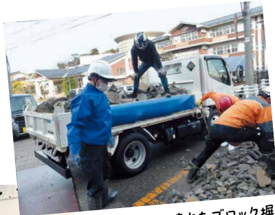
ボランティアが壊れたブロック塀を運びます(津幡町)