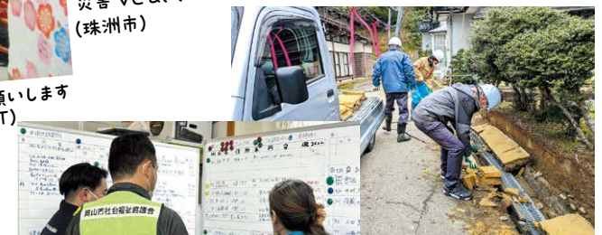
1人では持つことができないものも運搬してくれます(宝達志水町)