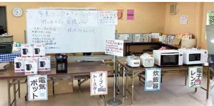
家電バンクで、避難されてきた方に少しでも安心を(野々市市)