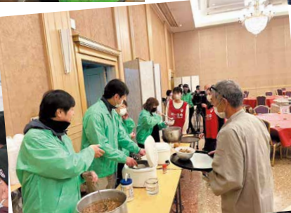
二次避難所でボランティアが食事をふるまいます(加賀市)