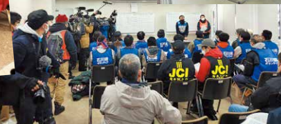
活動初日には多くのマスコミも訪れました(七尾市)