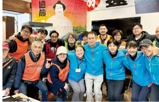
ONE TEAM 復興に向け心は一つ(穴水町)