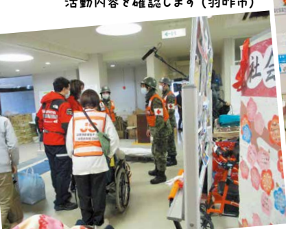
被災施設からの移送 自衛隊さんお願いします(老施協 DWAT)