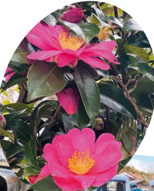
みさきデイサービスセンターの庭に美しく咲きほこっています(珠洲市)