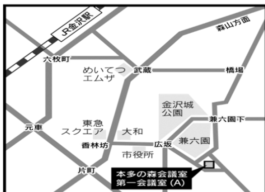
本多の森会議室 (石川県本多の森庁舎内) ※石引駐車場無料割引有