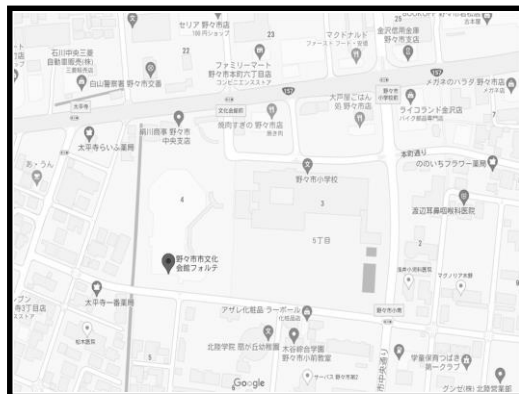
野々市市文化会館フォルテ 〔野々市会場〕